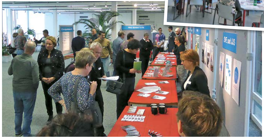
In lockerem Rahmen werden Themen wie Vorsorge, Recht und Gesundheit behandelt.

Mit einer Pensionierung hat niemand persönliche Erfahrungen. Umso wichtiger ist es, sich darauf vorzubereiten und von Wissen und Erfahrungsschatz