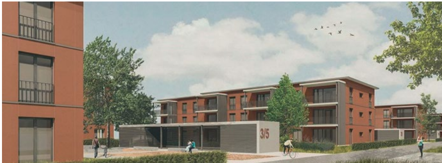
An der Grubenstrasse 3 bis 17 entstanden dank der SVE 72 moderne und preisgünstige Wohnungen – kein Wunder, sind sie alle schon vermietet.