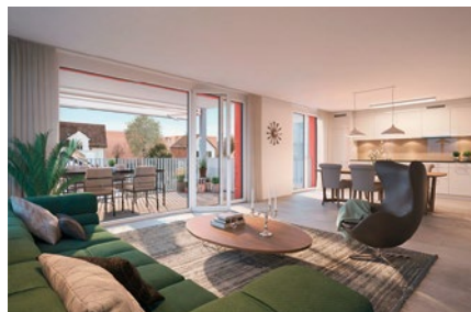
Heute wohnt man grosszügig und energietechnisch auf neuestem Stand.

Winterthur gilt zu Recht als Gartenstadt. Das Architektenteam asa AG und