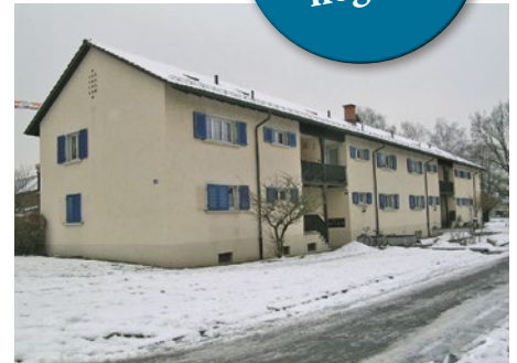
Die ersetzten Wohnungen waren klein und energietechnisch veraltet.

Die Siedlung der Sulzer Vorsorgeeinrichtung SVE aus dem Jahr 1951 im Quartier Hegi in Oberwinterthur war in die Jahre gekommen: Schlecht isolierte Bauten, veraltete Installationen und kleinteilige Wohnungen entsprachen der heutigen Zeit nicht mehr. Deshalb hat die SVE 2017 den Bau von Ersatzneubauten in Auftrag gegeben: Realisiert wurden in ihrem Auftrag vom Immobiliendienstleister Auwiesen Immobilien AG vier moderne Mehrfamilienhäuser mit 72 Wohnungen.