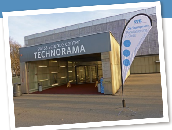
Jahrgangsberechtigte werden separat ins Technorama eingeladen.

Die beliebte SVE-Tagungsreihe «Pensionierung in Sicht» bereitet umfassend und unterhaltsam auf das Rentenalter vor.