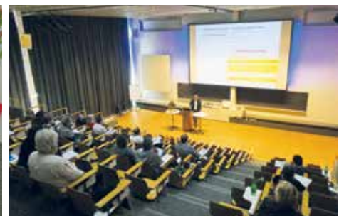
SVE-Veranstaltung «Pensionierung in Sicht»: Viel Information, spannende Themen mit kompetenten Referenten.