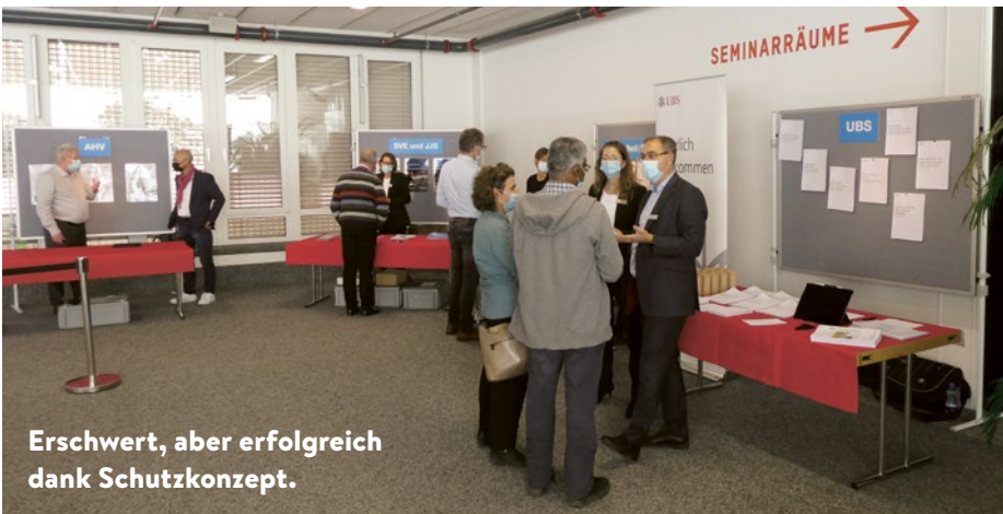
Erschwert, aber erfolgreich dank Schutzkonzept.

Am 10. und 17. November fand der erste Teil der beliebten Tagungsreihe «Pensionierung in Sicht» im Technorama Winterthur statt.